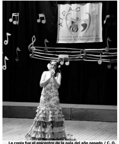
La copla fue el epicentro de la gala del año pasado