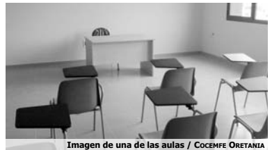
Imagen de una de las aulas

Ahora sólo queda el momento de la firma para hacer efectiva di-