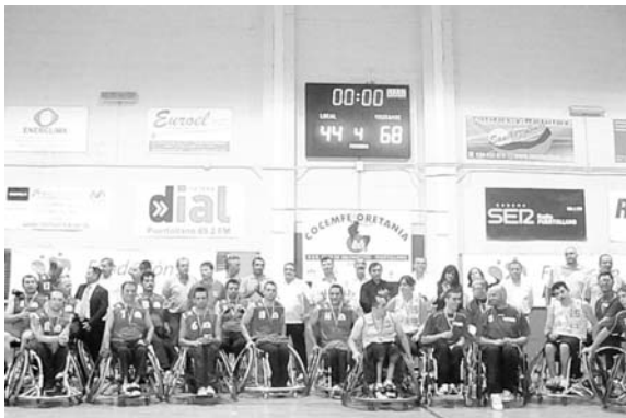
El Cocemfe Puertollano contra el Casa de Murcia de Getafe en las Jornadas del Deporte Organizadas por Repsol

El año 2011 finalizará con un encuentro en casa contra el CB Sureste Gran Canaria. El equipo espera que las muestras de la afición sigan siendo tan positivas como las de la anterior jornada e invita a la localidad y los ciudadanos de municipios cercanos a las próximas citas en el pabellón Santiago Cañizares.