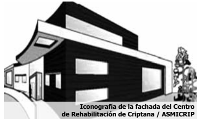
Iconografía de la fachada del Centro de Rehabilitación de Criptana / ASMICRIP

La construcción de un Centro de Rehabilitación y Mantenimiento para personas con discapacidad física gravemente afectadas es un proyecto por el que llevan trabajando más de cuatro años