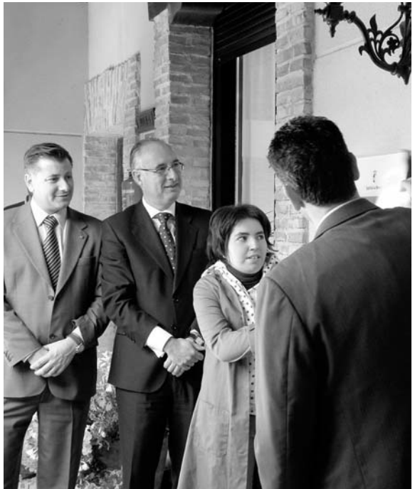
Inauguración del Centro Ocupacional de Boñafos de Calatrava / COCEMFE ORETANIA

boral en la provincia. "El Departamento de Información y Gestión atiende diariamente desde entonces a más de 15 demandas. La mayoría relacionadas con formación empleo, accesibilidad, ayudas técnicas, deporte, ocio y tiempo li-