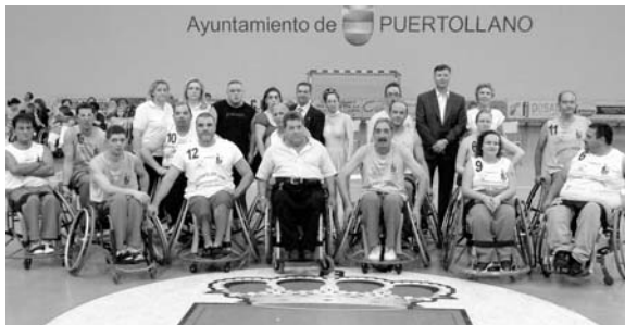
Imagen de archivo del equipo de Baloncesto en Silla de Ruedas Cocemfe Oretana

Algunos autores afirman que veinte años no es nada, pero para Cocemfe Ciudad Real existe un cambio significativo entre cómo éramos y cómo somos. Y es que la federación contribuye cada día a hacer provincia y hacer ciudadanos, siendo fiel testigo de la evolución de la sociedad en torno al mundo de las personas con discapacidad, allanando en muchas ocasiones mentalidades ancestrales y convirtiéndolas en otras más libres, solidarias y humanas.