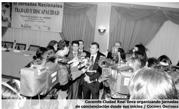
Cocemfe Ciudad Real lleva organizando jornadas de concienciación desde sus inicios