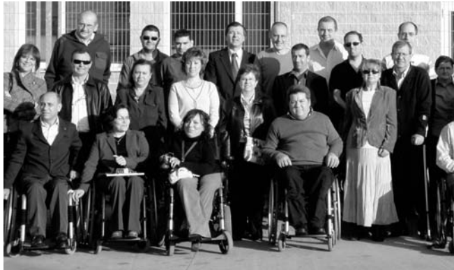
Foto de familia de los representantes de Cocemfe Ciudad Real y sus socios

A partir de ese momento ha sido constante y continua, desarrollando importantes áreas como son: la formación, el empleo, la accesibilidad, la información y el asesoramiento; el ocio y el deporte y los recursos asistenciales. De esta manera, los primeros pasos contaron con el apoyo de Cocemfe Castilla-La Mancha, gracias a su intervención se creó la primera unidad del Servicio de Integración La-