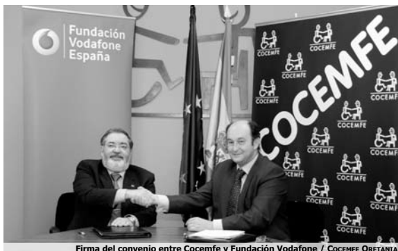
Firma del convenio entre Cocefme y Fundación Vodafone

El objetivo principal es potenciar las competencias socio-laborales de las personas con discapacidad desde los nuevos medios