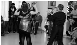
Una hermosa iniciativa / COCEMFE ORETANIA

Sin duda, una hermosa iniciativa apta para todos los públicos con las que además se ayudará a la incansable e incondicional labor en la que Fisen-si aboga por las personas con discapacidad.