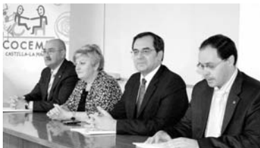
Mesa de ponentes de la Jornada sobre Atención Sociosanitaria