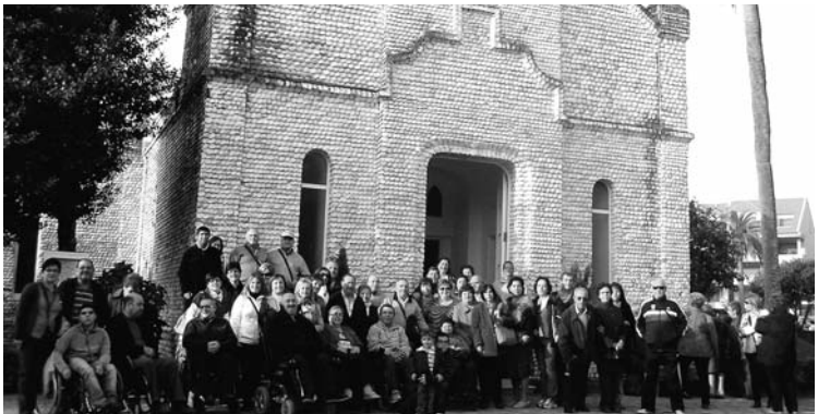
Foto de familia de Asmicrip en su viaje a Galicia

La entidad criptanense quiere agradecer el apoyo de Promancha, por la aprobación de este expediente de subvención y la colaboración del Consistorio de Campo de Criptana, por su concienciación en los proyectos de ayuda para las personas con discapacidad.