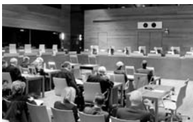
Vista / TRIBUNAL DE JUSTICIA DE LA UNIÓN EUROPEA

alemanes consultaron al Tribunal de Justicia sobre el caso.