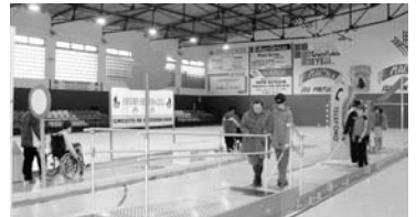
Jóvenes realizando la actividad / COCEMFE ORETANIA

Con las mismas premisas se está trabajando para crear conciencia en el resto de la ciudadanía. Así, en pocas semanas tendrá lugar una pegada de carteles por parte del grupo universitario Letras Solidarias . La temática predominante será la promoción del respeto a las normas de circulación que benefician a las personas con capacidades diferentes, como aparcamientos y accesos preparados principalmente para el colectivo. También se tiene previsto una publicación de los dibujos premiados en la II Edición del Concurso de Dibujo "Educación y Discapacidad" dirigido a todos los colegios de la capital. Los ciudadanos podrán contemplarlos en diez espacios publicitarios del mobiliario urbano durante unos días, en detrimento de los usuales carteles publicitarios.