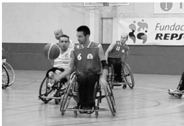
Momento del partido disputado en las Jornadas del Deporte de Repsol / COCEMFE PUERTOLLANO