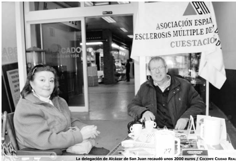
La delegación de Alcázar de San Juan recaudó unos 2000 euros

De esta manera, la delegación alcazareña ubicó las mesas en puntos clave como los dos Cen-