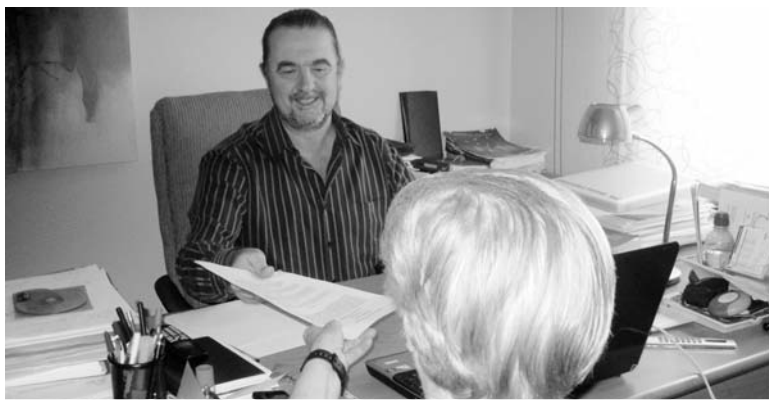
Un miembro de Acrear asesora a un asociado