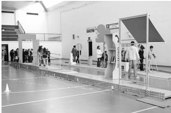
El circuito accesible ha estado en lugares públicos y centros educativos