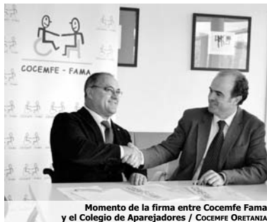
Momento de la firma entre Cocemfe Fama y el Colegio de Aparejadores

Ambas entidades suscriben un convenio de colaboración para instrumentar acciones coordinadas entre ambas en materia de accesibilidad y diseño universales